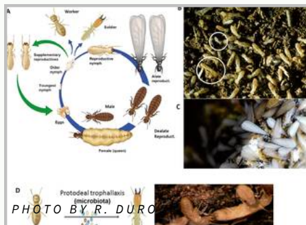
Siklus hidup rayap

Secara aspek biologi, rayap terbagi menjadi 3 kategori yaitu Rayap kayu basah (dampwood termite) , Rayap kayu kering (Drywood termite) , dan Rayap tanah (Subterranean termite) . Kategori rayap kayu kering dan rayap tanah menjadi kelompokkan rayap secara signifikan menyebabkan kerusakan pada struktur bangunan yang terbuat dari material kayu. Meskipun kasus serangan rayap yang dominan adalah akibat serangan rayap tanah.